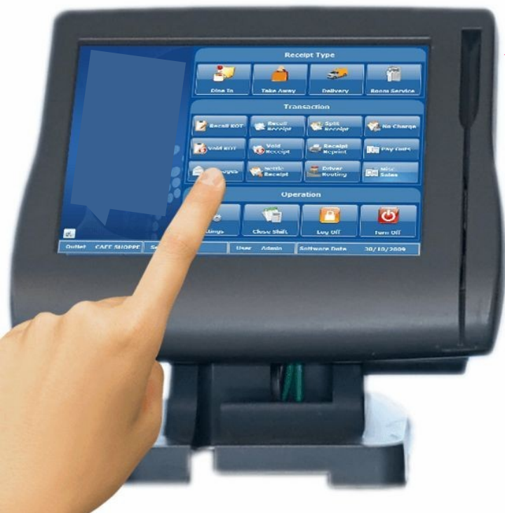
Ugrađena POS mašina